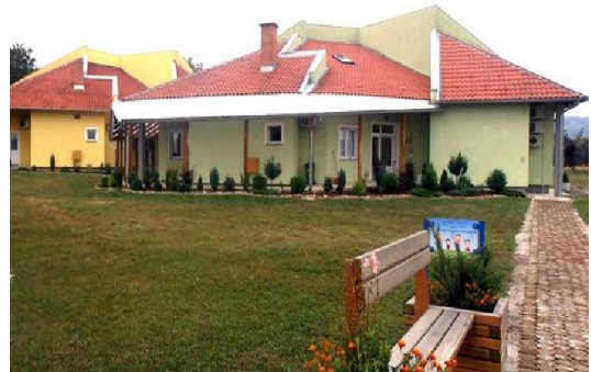
Udruga MI, Požega