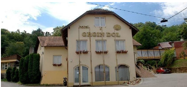
Art kino, Požega