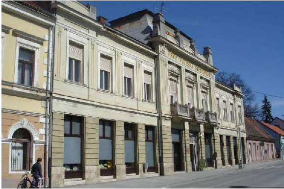
Gradska knjižnica i čitaonica Požega