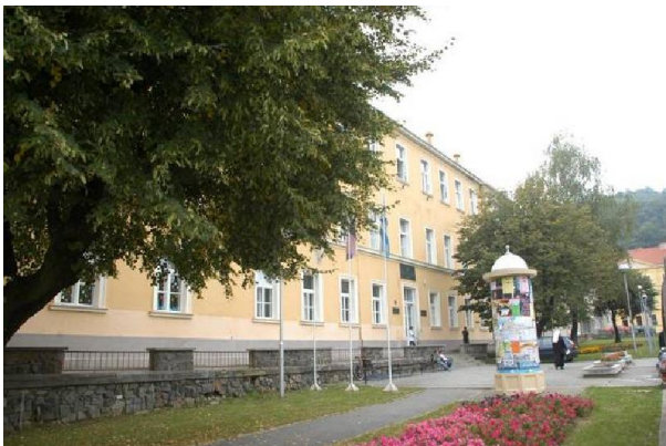
Katolička gimnazija, Požega